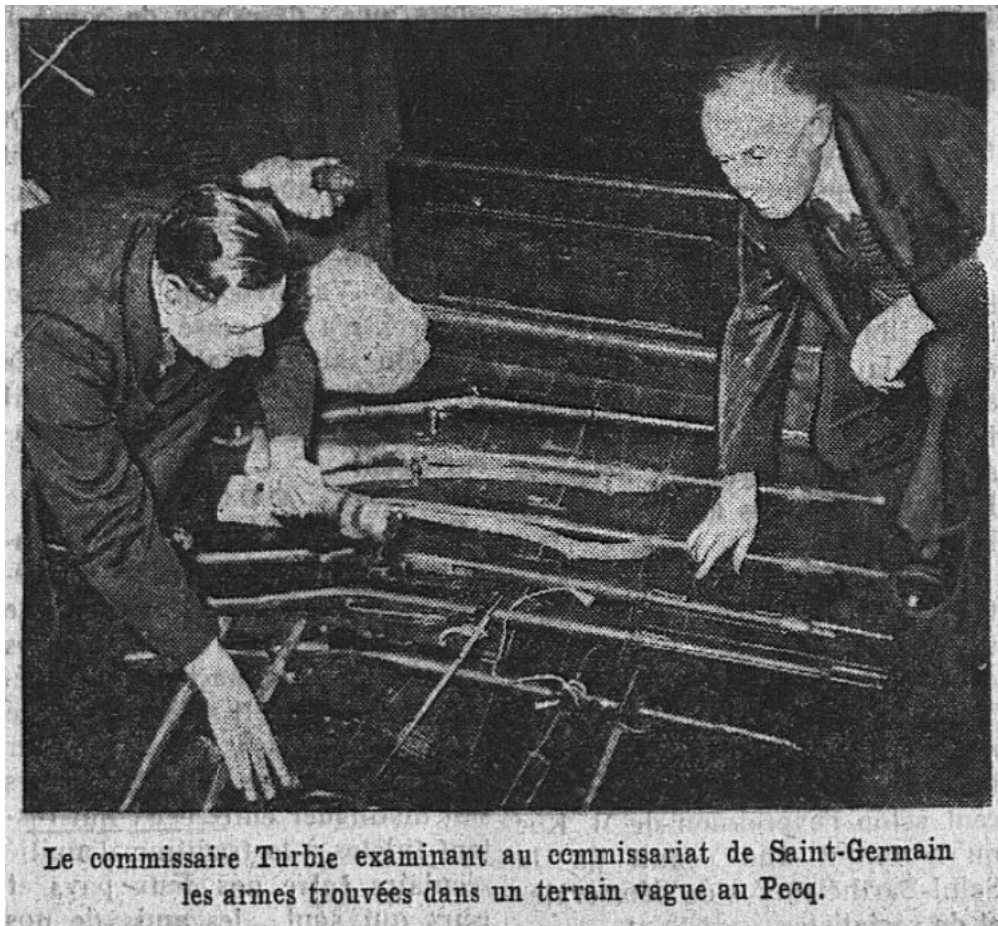
Illustration 1: Photographie prise par le journal Le Populaire, 2 décembre 1937, auteur inconnu.

Le Mauser M1889 est le deuxième fusil en partant du bas. Il est reconnaissable à la forme de son magasin dépassant légèrement en bas. Une autre possibilité serait un fusil à système Mannlicher comme le Carcano 1891, mais la forme du magasin semble plutôt indiquer le M1889.