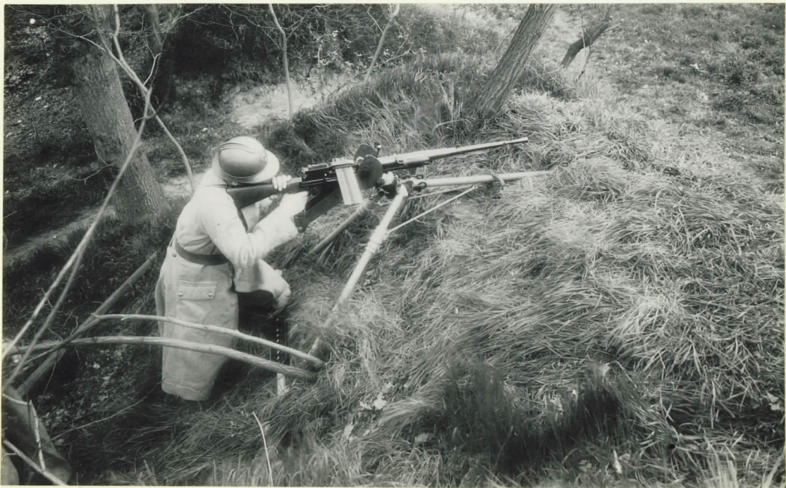
Figure IV - Mitrailleuse en batterie dans une tranchée.

Cet annexe est consacré à plusieurs illustrations pour assister le lecteur dans sa compréhension des différentes armes à feu de la Cagoule, mais aussi pour étayer les observations et considérations faites sur certaines de ces armes dans ce mémoire.