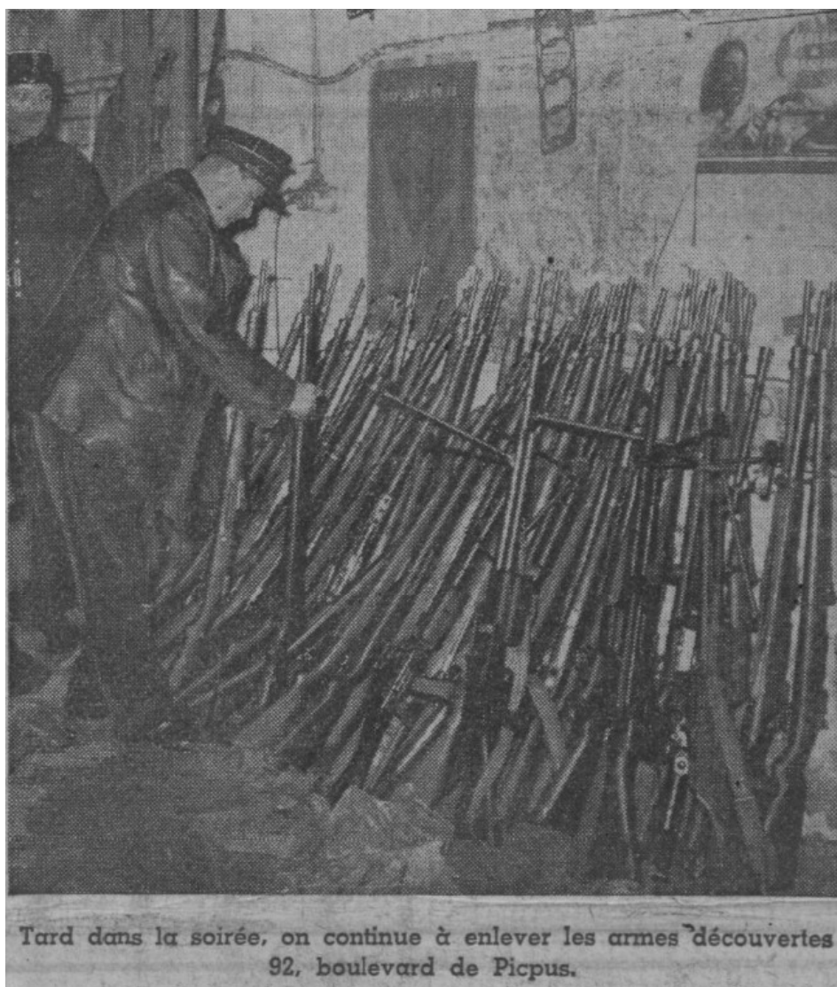
Illustration 2: Photographie prise par le journal Paris Soir, 17 décembre 1937, auteur inconnu.

On peut ici voir des policiers alignant des armes prises dans le dépôt du Boulevard de Picpus. Sur la gauche, on peut constater la présence de Gewehr 98, reconnaissable à leurs viseurs surélevés appelés « Lange Visier ». La plupart des fusils à verrou présents sur cette image semblent être des Gewehr 98.