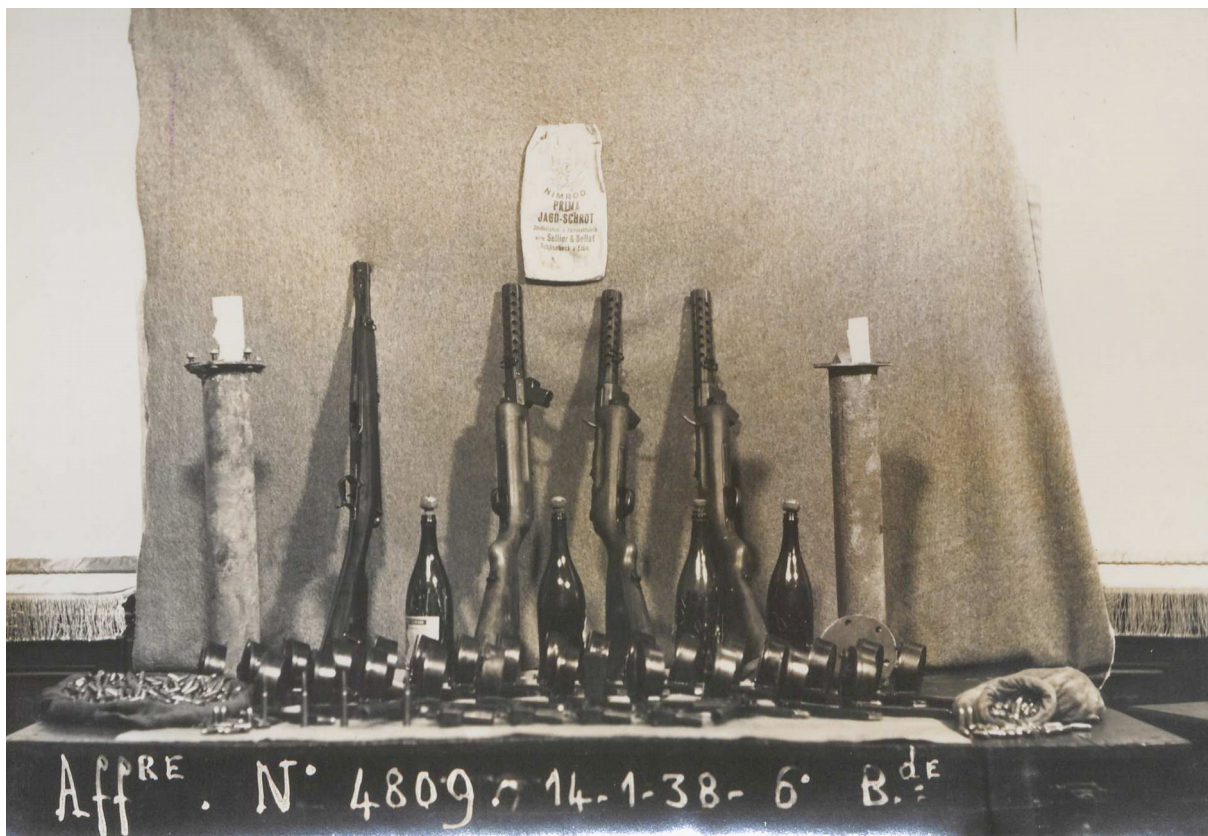
Illustration 4: Armes saisies à la Cagoule par la police, photographie prise à Clermont-Ferrand le 18 janvier 1938, auteur inconnu, carton d'archive F/7/14673 des Archives Nationales.

On peut constater sur cette image, à gauche, un Beretta M1918/30, puis sur la droite trois MP18/I. Les bouteilles et sac contiennent des munitions, et enfin les sortes de boites rondes sont les magasins « Trommel » du MP18. Ces armes devaient être les plus importantes dans l'arsenal de la Cagoule, en amenant une puissance de feu automatique dans les moyens de combat de l'organisation.