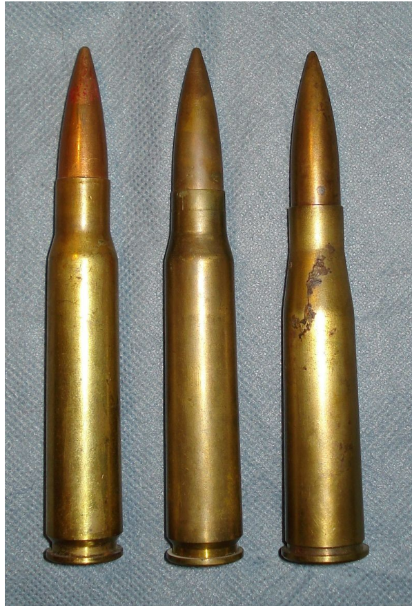
Illustration 7: Photographie de trois balles de 13,2mm, le 21 juin 2009, photo prise par un certain Costas-1963.

Les trois cartouches ici montrées sont de gauche à droite :13,2x96mm Hotchkiss, 13,2x92mm Hotchkiss, 13,2x92mm Tank und Flieger. On constate que chacune de ces balles est différente de l'autre, en particulier la cartouche de 13,2x92 Hotchkiss et la 13,2x92 TuF. Cette dernière dispose d'un goulot plus allongé et moins net que la cartouche Française, mais également un bord à la base de la cartouche pour aider l'extraction après le tir.