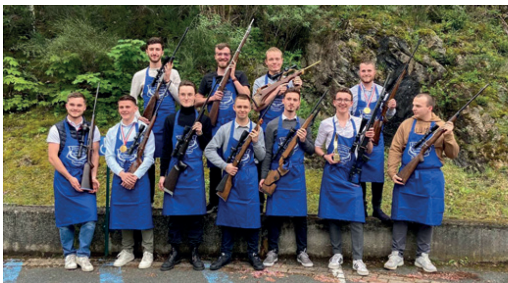
Trophée des arquebusiers 2023.

Plusieurs fois par ans, l'UFA publie Légit-Arm , un bulletin d'information à destination de ses membres, mêlant reportages chez des acteurs de terrain, enquêtes de fond et actualités réglementaires. Dans le numéro de janvier 2024, l'équipe rédactionnelle a publiée par le détail la nouvelle doctrine de classement des armes anciennes de collection. Une doctrine tout juste publiée par le ministère de l'Intérieur avec qui l'UFA a beaucoup travaillé, pour parvenir à finaliser ce projet.