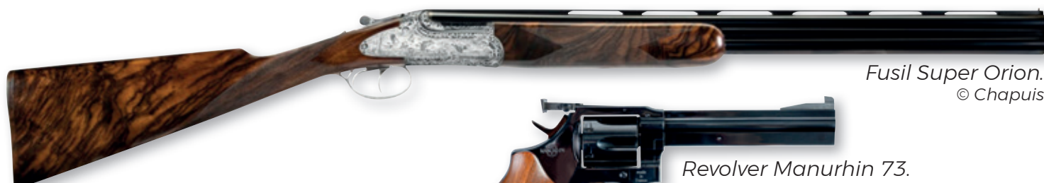
Fusil Super Orion. © Chapuis