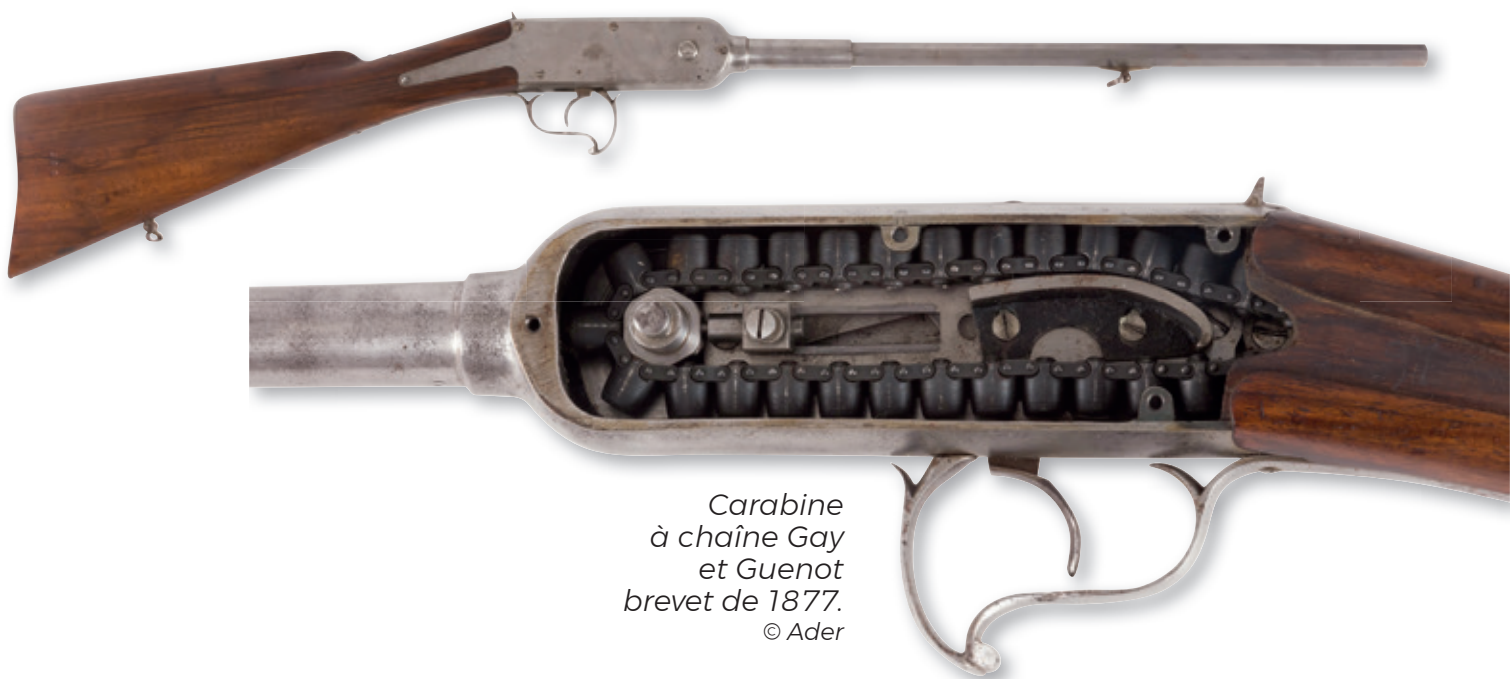
Carabine à chaîne Gay et Guenot brevet de 1877.

Sans passé, le présent n'a pas d'avenir. Sensibiliser l'opinion publique à l'identité culturelle et industrielle des armes, ainsi qu'à leurs enjeux futurs, est le meilleur moyen d'assurer la pérennité de ce patrimoine.