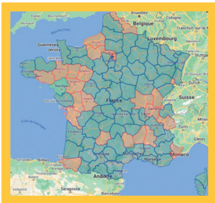
Implantation des délégués UFA en régions.

Plus de 90% de nos adhérents vivent hors de la région parisienne, signe d'un ancrage sur l'ensemble du territoire et d'une diversité géographique. L'association est ouverte à tous et accueille les débutants, les confirmés, les experts, les passionnés, les curieux et les sympathisants.