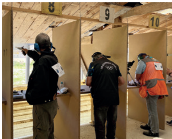
Rassemblement ADF 2024.

Plusieurs fois par ans, l'UFA publie Légit-Arm , un bulletin d'information à destination de ses membres, mêlant reportages chez des acteurs de terrain, enquêtes de fond et actualités réglementaires. Dans le numéro de janvier 2024, l'équipe rédactionnelle a publiée par le détail la nouvelle doctrine de classement des armes anciennes de collection. Une doctrine tout juste publiée par le ministère de l'Intérieur avec qui l'UFA a beaucoup travaillé, pour parvenir à finaliser ce projet.