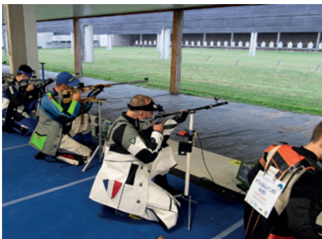
Concours de tir.