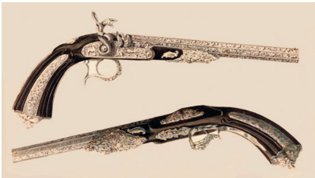
Étude de pistolets de tir par Devisme à Paris en 1840.