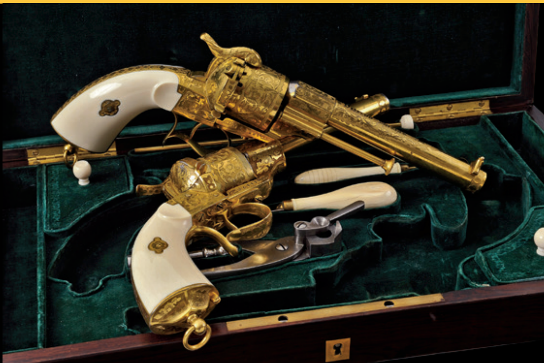
Paire de revolvers Lefauchaux de luxe vers 1860.