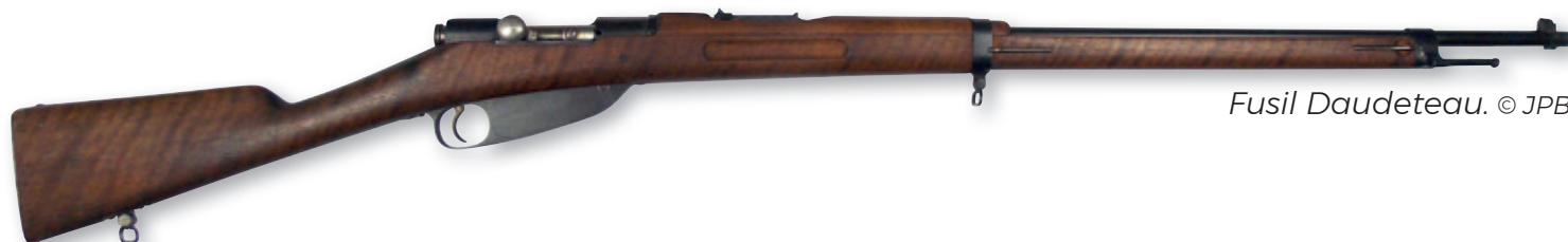
Fusil Daudeteau.