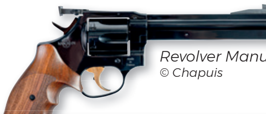
Revolver Manurhin 73.