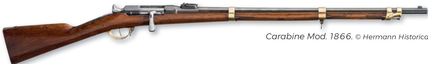
Carabine Mod. 1866.

Notre pays compte un millier de points de vente et près de 800 armuriers.