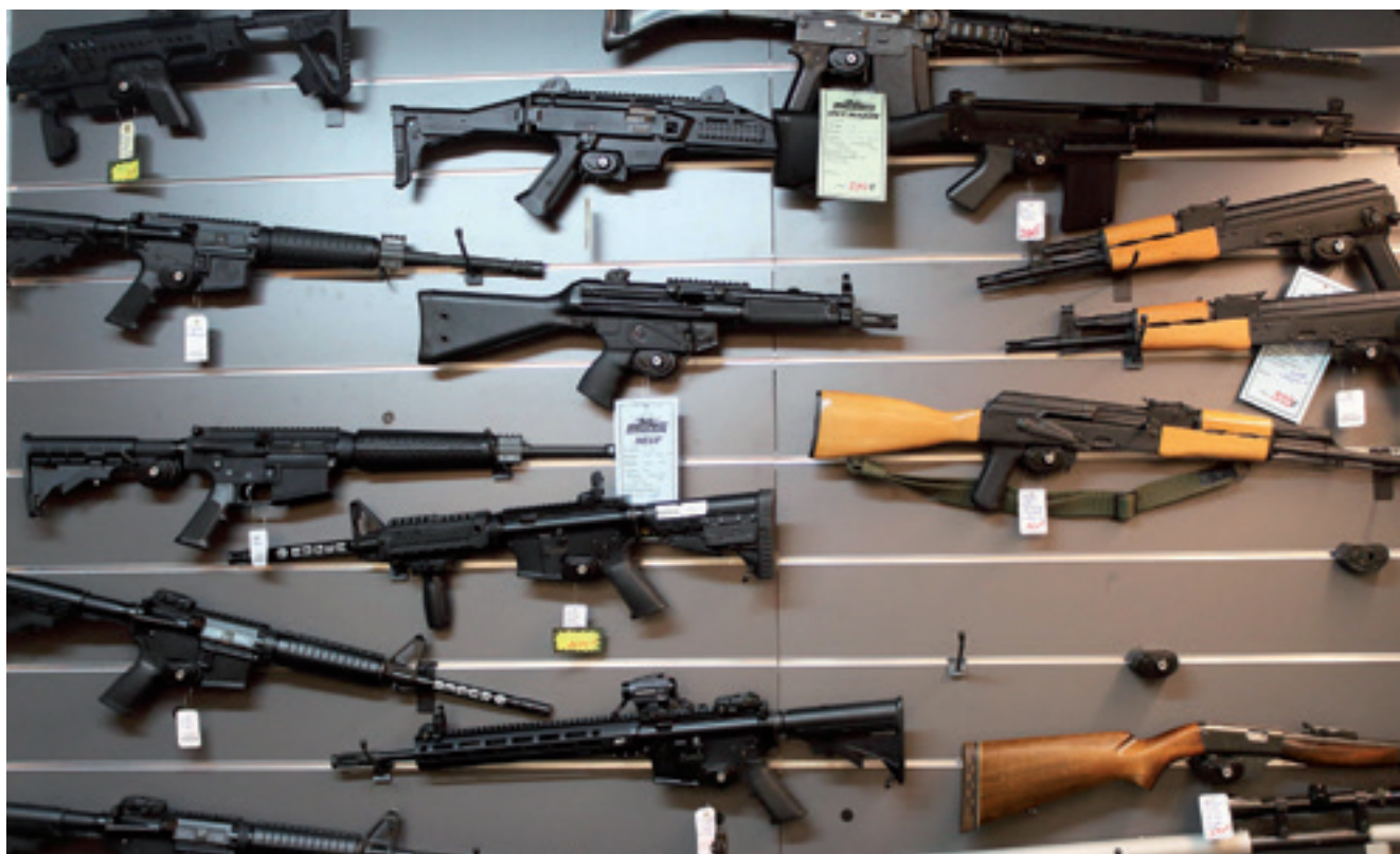
Les armes semi-auto « Sporter » sont très prisées des tireurs.