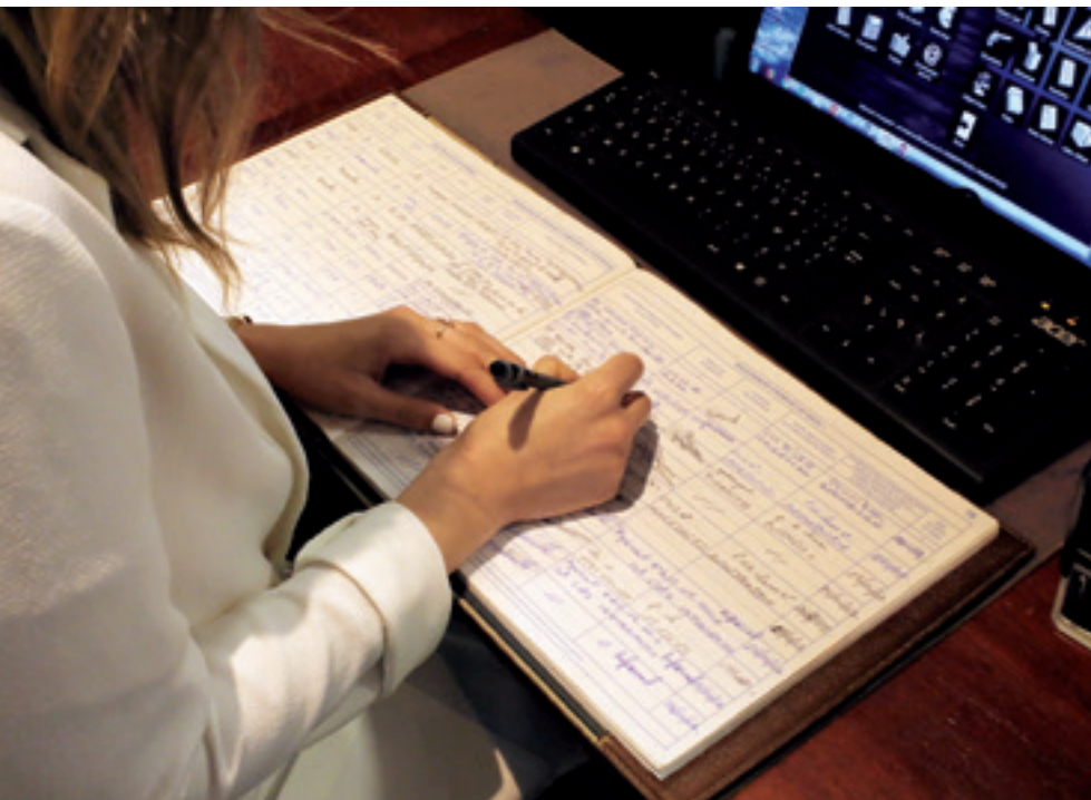
Il doit également porter sur son registre, la vente entre les deux particuliers.

A noter que l'option de l'ancienne possibilité de faire constater la vente par une autorité de police a été supprimée de la réglementation.