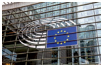
C'est le parlement européen qui aura le dernier mot, mais encore faut-il un texte pour pouvoir voter !

Les armes semi-automatiques militaires converties : la Commission voudrait une interdiction totale de ces armes, les députés souhaitent interdire uniquement celles qui peuvent être reconverties.