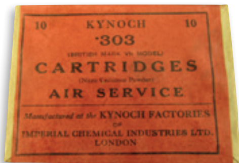
Etiquette rouge d'une boîte de cartouches de .303 réservées à l'aviation (Air Service).

fait de la guerre. Le commandement du Royal Flying Corps, qui devient plus tard la RAF, exige que les dimensions de chaque cartouche destinée à alimenter les mitrailleuses d'avions soit vérifiée individuellement et avec le plus grand soin. Ainsi les munitions jugées conformes seront désormais emballées dans un paquet à étiquette rouge mentionnant « Air Service ».