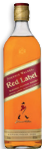
L'étiquette rouge « Red Label » reprise par le fabricant de Scotch.

Le célèbre fabricant de Scotch a « piqué » l'idée pour valoriser ses produits.