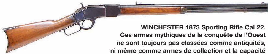
WINCHESTER 1873 Sporting Rifle Cal 22. Ces armes mythiques de la conquête de l'Ouest ne sont toujours pas classées comme antiquités, ni même comme armes de collection et la capacité de leur magasin les classe en 4 e catégorie.