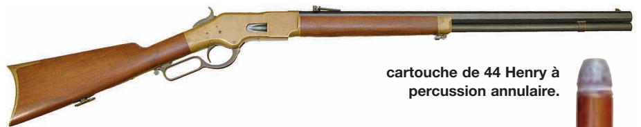
cartouche de 44 Henry à percussion annulaire.

Avec une classification intelligible, il